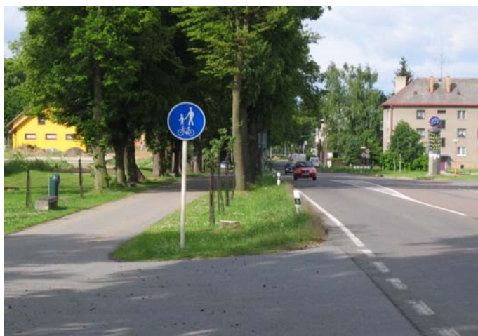
Obr. 3.18b: Příklad řešení vedení stezky pro chodce a cyklisty se společným provozem(Lanškroun)