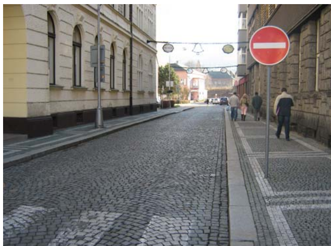
Obr. 3.18a: Ulice 1.Máje (pohled směrem do centra města)