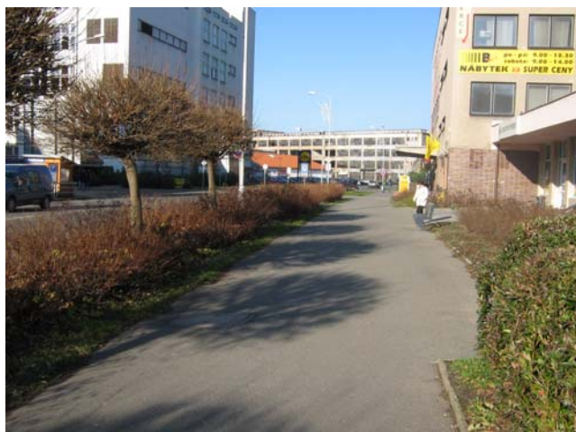
Obr. 3.12a: Ulice Plhovská (pohled směrem z centra) – současný stav