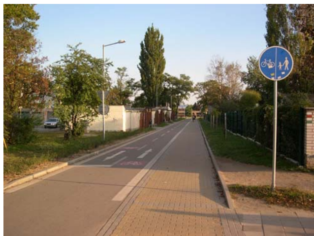
Obr. 3.12b: Příklad řešení vedení komunikace pro pěší a cyklisty s odděleným provozem – obousměrný provoz cyklistů (Hodonín)