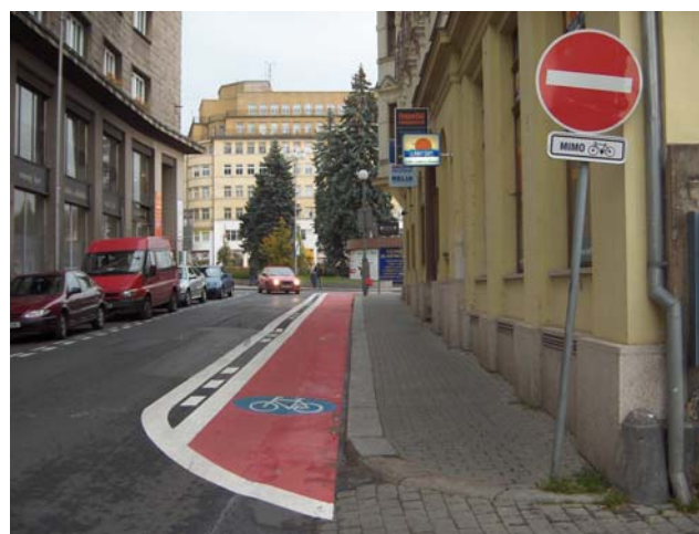
Obr. 3.18b: Příklad řešení vedení jednosměrného vyhrazeného jízdního pruhu pro cyklisty v jednosměrné komunikaci (Liberec)