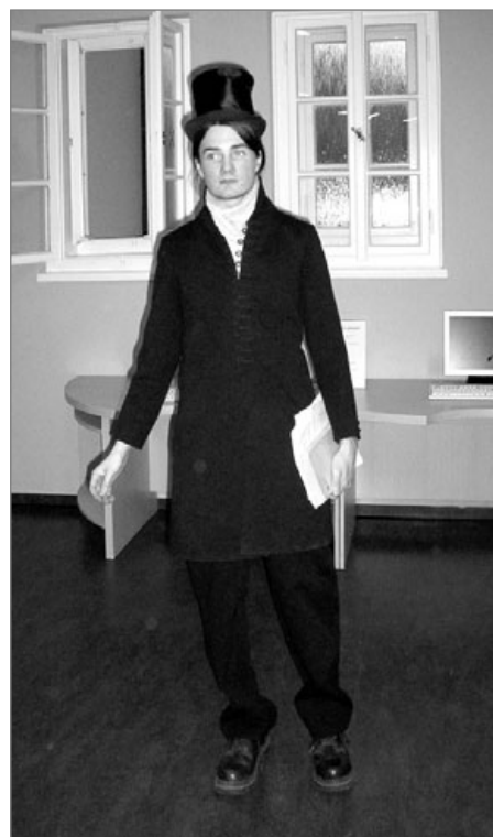
Během pohádkové noci přišel mezi děti sám pan Hans Christian Andersen

S omlouvou musíme doplnit informaci k jubilejnímu číslu Náchodského zpravodaje, které vyšlo v dubnu. Autory fotografií jsou: Martin Hurdálek, Daniel Kvasnička, autoři jednotlivých článků a archiv.