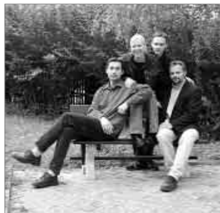
Pražská hudební skupina P.R.S.T.