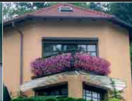
Balkony s květinami v ulicích Dvořákova, Na Pláni a Sokolská.