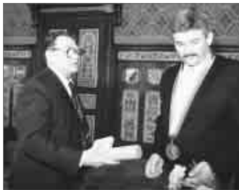
Vilém Přibyl právě obdržel diplom čestného občanství

Ve dnech 12.-14. května 1990 se uskutečnila první polistopadová náchodská návštěva spisovatele Josefa Škvoreckého a jeho ženy, spisovatelky Zdeny Salivarové. Jejím oficiálním vyvrcholením byl akt předání diplomu čestného občanství 14. 5. 1990. Předával ho tehdejší předseda MěNV Miloslav Čermák a ve svém projevu řekl: „ Proslavil jste naše město životností své tvorby. Sepsal jste významnou kapitolu jeho duchovních dějin. Díky za to a díky za příklad, jak hluboce má člověk prožívat svůj život a mít