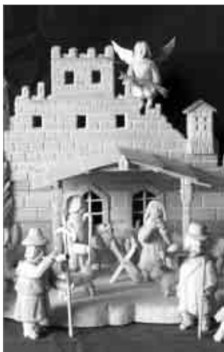
Betlém na titulní fotografii vyřezal Miroslav Šeřc z Náchoda.