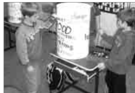
Děti při netradiční školní práci