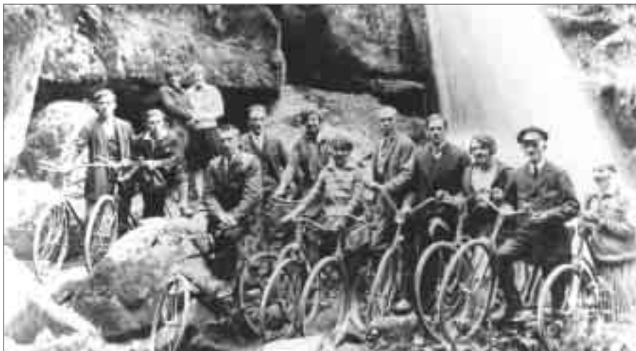
Výlet dělnického spolku cyklistů do skal (dvacátá léta 20. století)