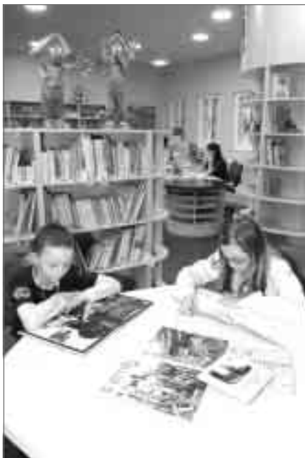
Náchodský zpravodaj březen 2007