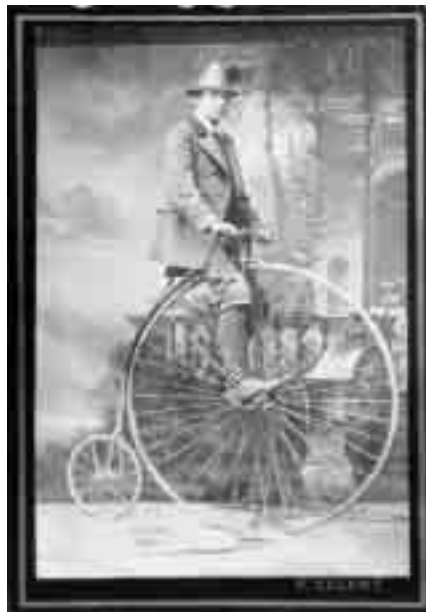
Princ Bedřich Schaumburg-Lippe na velocipedu (ateliérové foto před r. 1900)