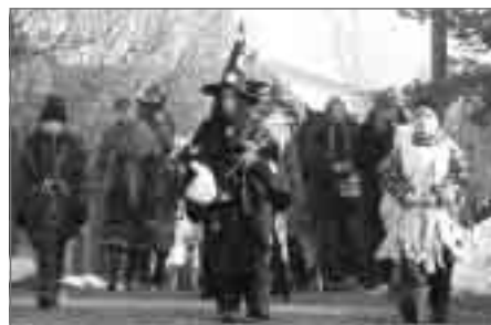
Masopustní veselí na Babí