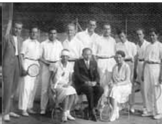
Výbor a závodní družstvo ten. oddílu r. 1926