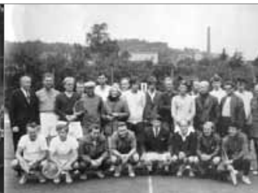
Okresní přebor 1970