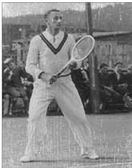
Vlasta Burian v Náchodě v r. 1936