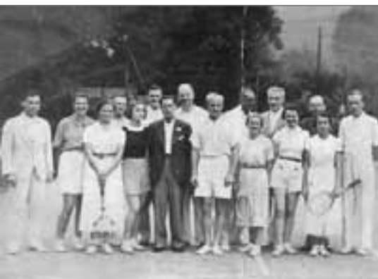
Členové tenisového oddílu z roku 1936