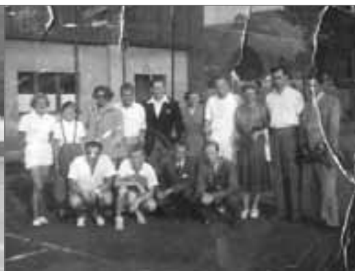
Z utkání Dvůr Králové - Náchod 1955