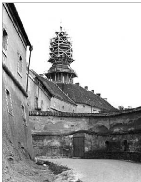
Plechování věže náchodského zámku v roce 1950.

A nyní tedy ten druhý důvod, proč o klempířích mluvíme. V roce 1995 totiž vznikl novodobý Cech klempířů, pokrývačů a tesařů ČR jako dobrovolné sdružení právnických a fyzických osob podnikajících v uvedených oborech. Dbá o rozvoj oborů a výchovu učňovského dorostu, každoročně pořádá tři učňovské soutěže a je členem prestižní mezinárodní federace. Z tohoto titulu se začátkem listopadu konal v naší republice mezinárodní kongres a světová soutěž mladých pokrývačů a klempířů. Můžeme být pyšní, protože nejlepší umístění získali hned za vítěznými Švýcary mladí Češi. Maizlové ani Vlčkové z Náchoda mezi nimi nejsou, ale kdoví, co přinese budoucí vývoj oboru. Mgr. L. Baštecká