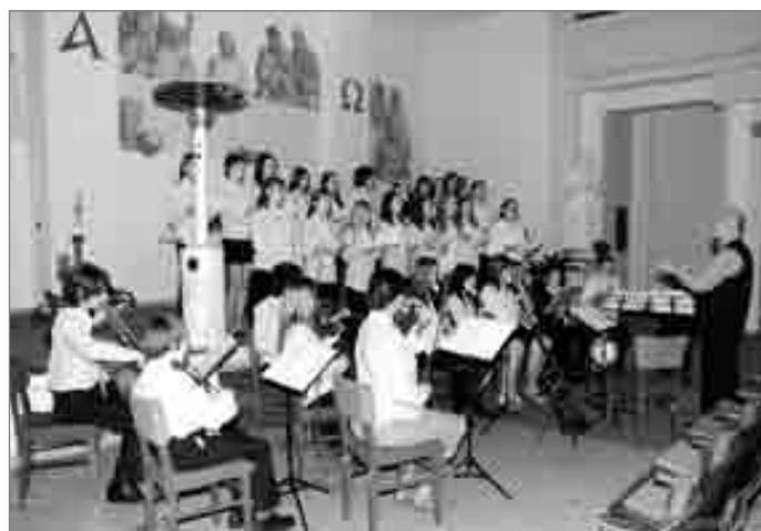
Vánoční koncert v Husově sboru 17. 12. 2008