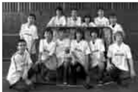
tým florbalistů 6.–7. tříd – turnaj v Liberci