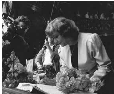
Přijetí na radnici v Náchodě v roce 1990