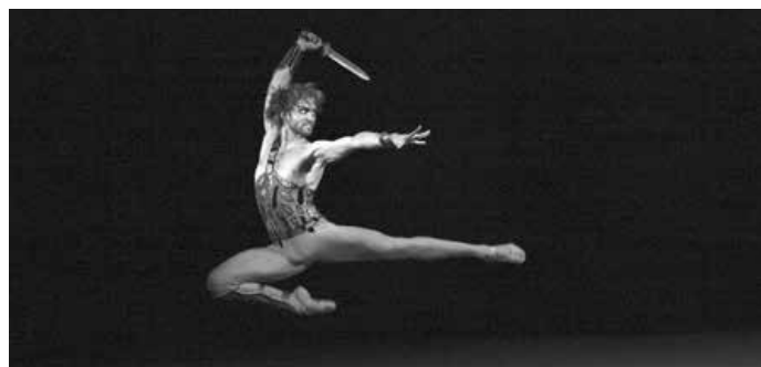
Zahajovací balet letošní sezóny a symbol Bolšoj baletu – velké heroické plátno Spartakus, které je výkladní skříň souboru s pověstnou nejlepší mužskou taneční technikou)

Vstupné v předprodeji 150 Kč, v den konání 200 Kč.