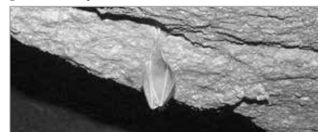
zimující vrápenec malý v Plh. podzemí